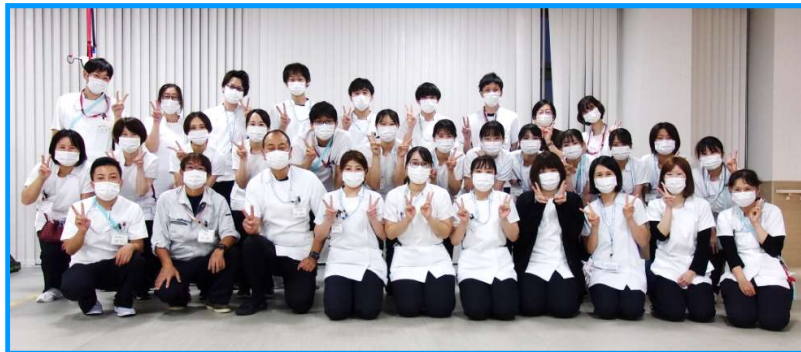
リハケア部 スタッフ数